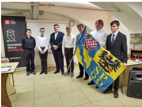
Tým Olomouckého kraje