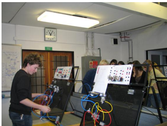
Workshop: učebna pneumatiky