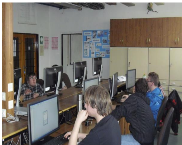
Workshop – učebna CNC s novou ICT