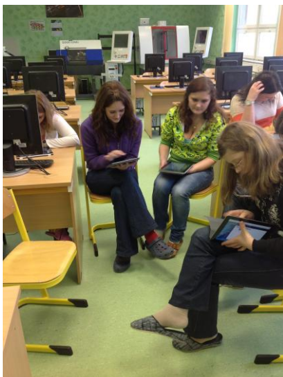
Nová ICT technika: práce s tablety