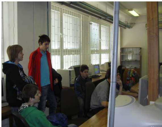
Workshop – učebna CNC s původní ICT