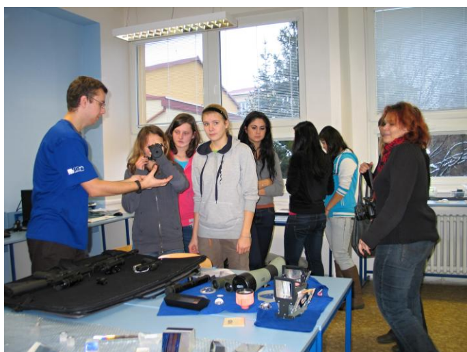
Workshop: učebna optiky