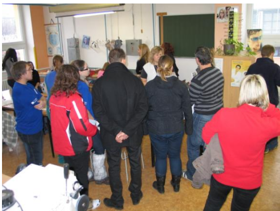
DOD: na dílně optiků