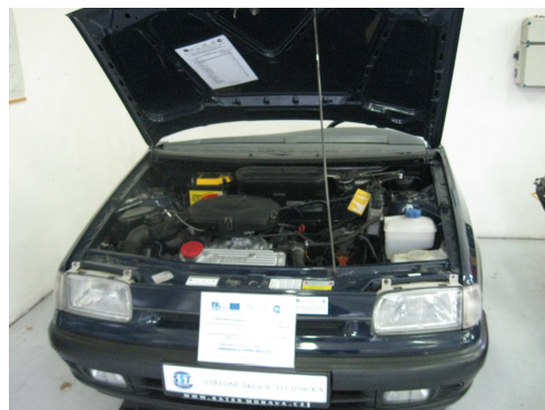
39. Simulační autopanel: „Jednobodové vstřikování paliva“.