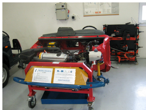
40. Simulační autopanel: „Vícebodové vstřikování paliva“.

Inovace výuky technických předmětů pro zvyšování konkurenceschopnosti žáků", CZ.1.07/1.1.04/02.0084