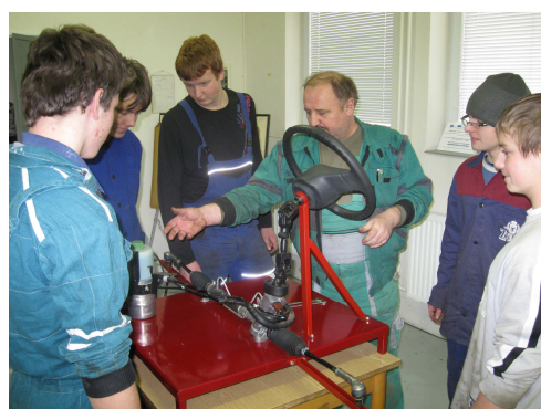
38. Simulační autopanel: „Elektrohydraulické servořízení“.

Inovace výuky technických předmětů pro zvyšování konkurenceschopnosti žáků", CZ.1.07/1.1.04/02.0084