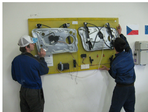
37. Simulační autopanel: „Elektrické ovládání oken a centrální zamykání“.