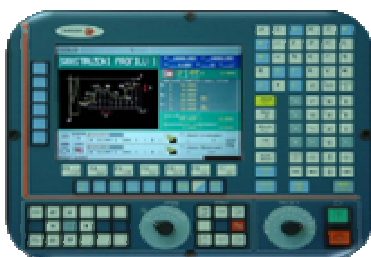
programování CNC strojů

Obor mechanik seřizovač - mechatronik čtyřletý obor vzdělání zakončený maturitní zkouškou. Příprava žáků je zaměřena na obsluhu, programování, seřizování a diagnostiku číslicově řízených strojů, výrobních linek a automatizovaných systémů. Zároveň je studium zaměřeno na automatizační prvky, řídicí systémy, části a mechanismy strojů a robotiku.