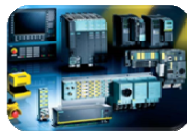
řízení a regulace