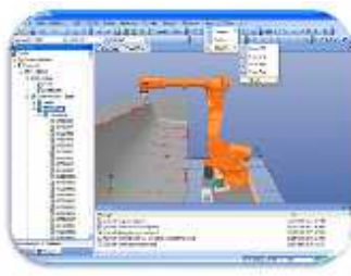
CAR – počítačová podpora robotiky