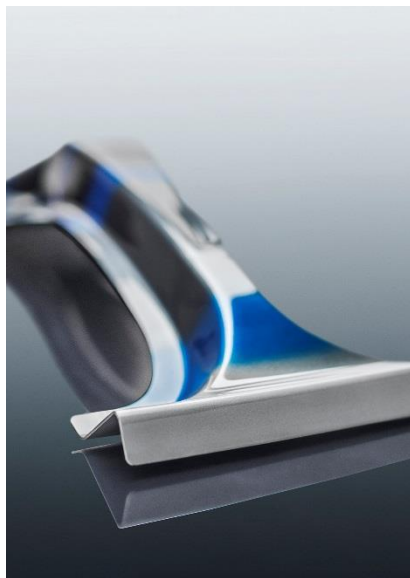
Karoserie / Interiér